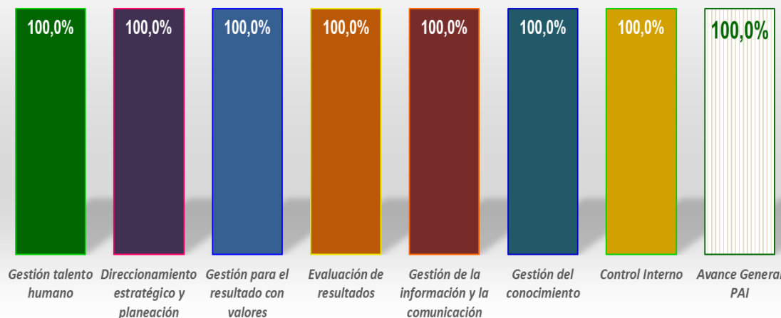
Avance Plan de Acción Institucional por Dimensiones IV trimestre 2019

Avance de cumplimiento del 100%, dando alcance a las metas establecidas para la vigencia.