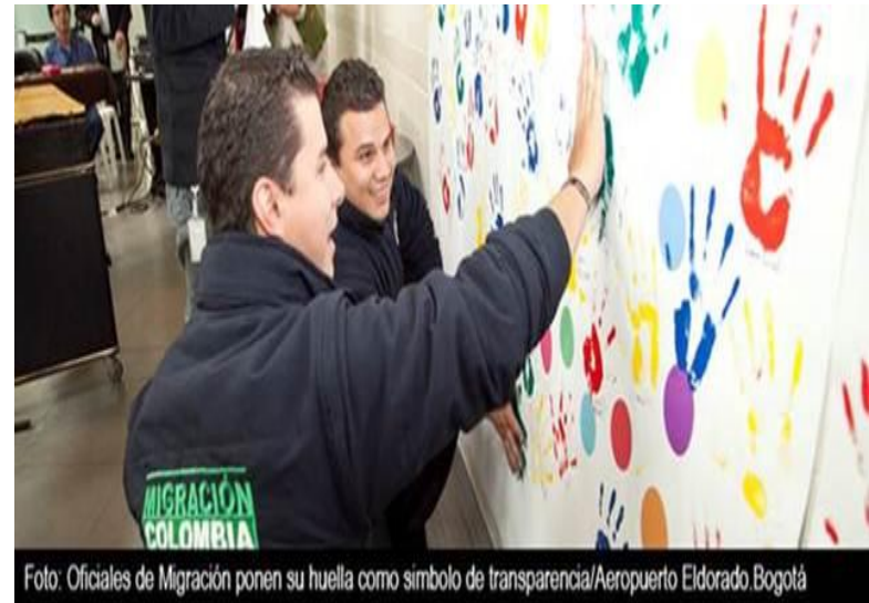
Foto: Oficiales de Migración ponen su huella como símbolo de transparencia/Aeropuerto Eldorado Bogotá