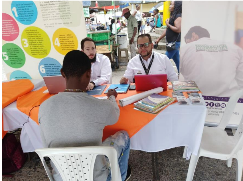
Foto 3: Atención a ciudadanos Feria Nacional de Servicio al Ciudadano, Quibdó, Chocó.