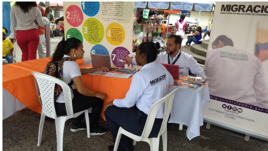
Foto 4: Atención a ciudadanos Feria Nacional de Servicio al Ciudadano, Quibdó, Chocó.