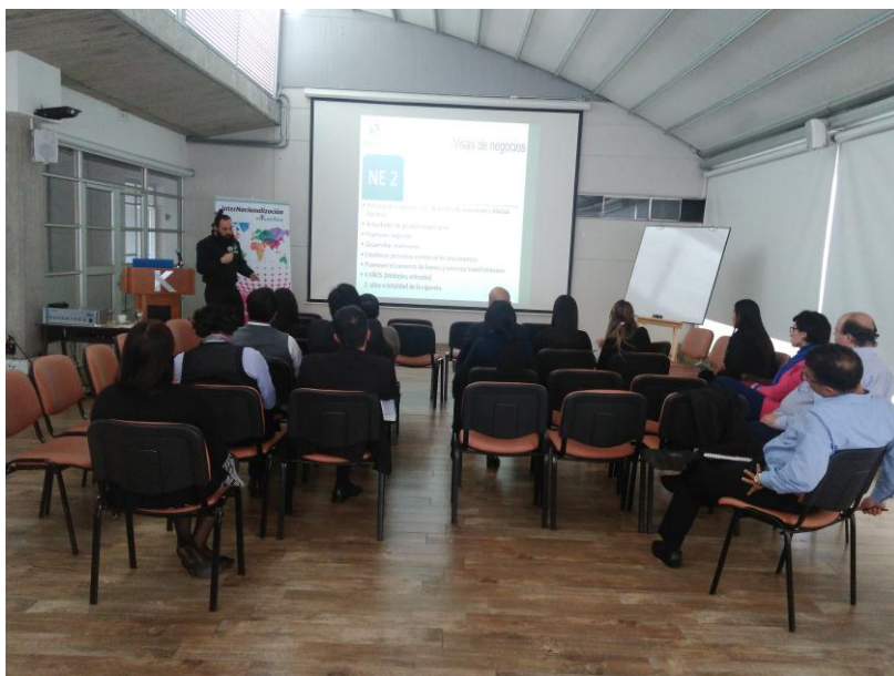
Foto 1. Explicación norma