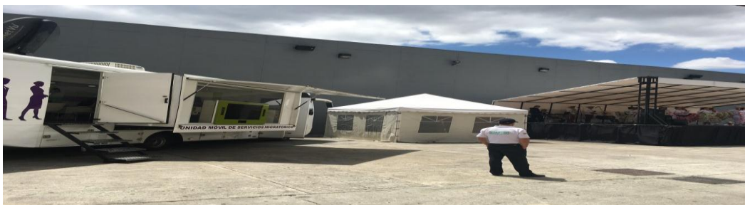
Fotos: Unidad Móvil de Servicios Migratorios frente al pabellón 16 en Corferias, Bogotá.